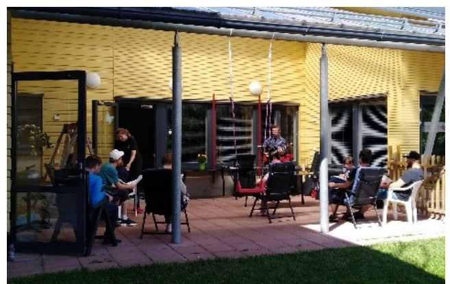
Bild från partyt på Smörblommegränd.