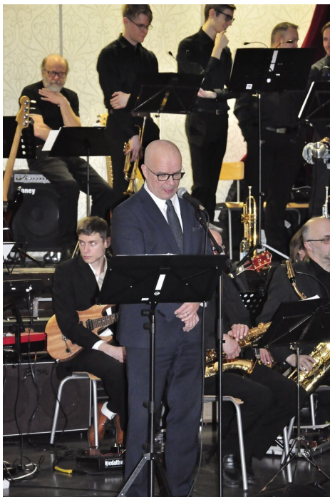
förde Vasa stads hälsning