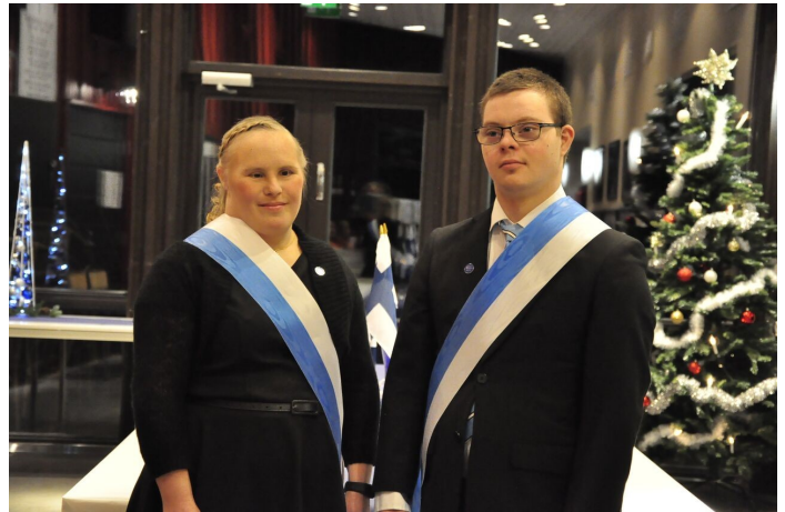
rade som marskalk.