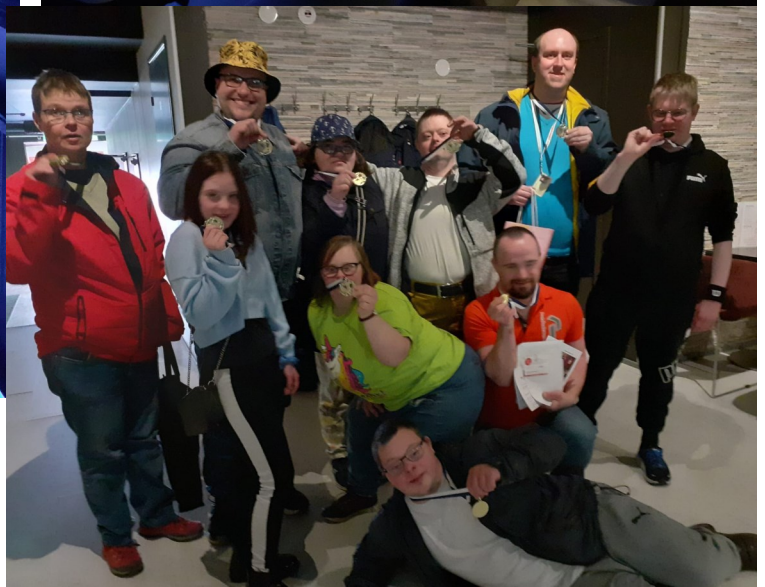
Bilder från fjolårets bowlingturnering.