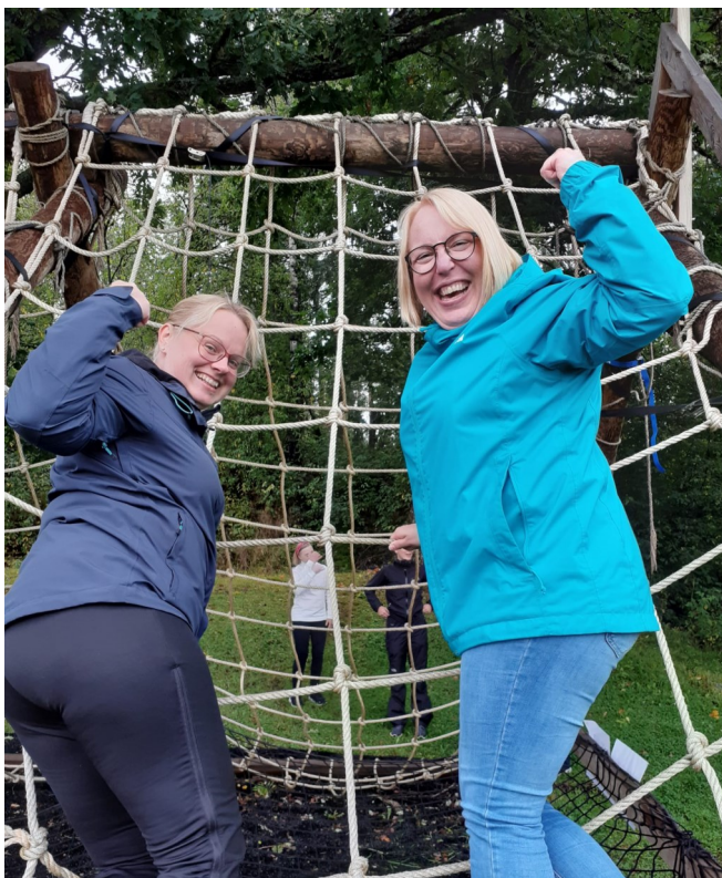
Bilder från fjolårets aktivitetsdag.

Anmälan? Senast 2 maj till 040 543 45 56 eller vasanejden@duv.fi